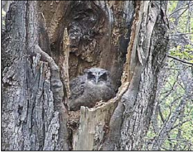
Птенец рыбного филина ( Ketupa blakistoni ) в гнезде.

The chick of the Blakiston's Fish Owl ( Ketupa blakistoni ) in the nest.