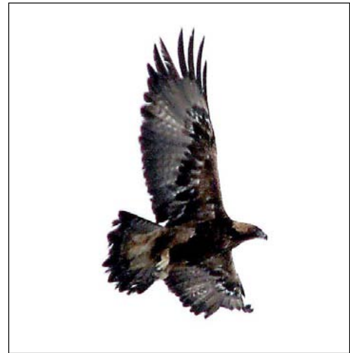
Беркут ( Aquila chrysaetos ). Бескарагайский район, Восточно-Казахстанская область. 8 февраля 2006 г.

Карякин И.В., Барабашин Т.О., Левин А.С., Карпов Ф.Ф. Результаты исследований 2005 г. в степных борах на северо-востоке Казахстана. – Пернатые хищники и их охрана. 2005. № 4. С. 34–43.